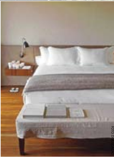
Em sentido horário, a partir do alto, à esq.: a enóloga Carla Fallabrino entre as parreiras; a vista da vinícola Alto de la Ballena; o começo da noite no Soho, no porto; um quarto do Fasano Las Piedras; o pintor Zuloaga em ação; e a torre de doce de leite da sorveteria Volta