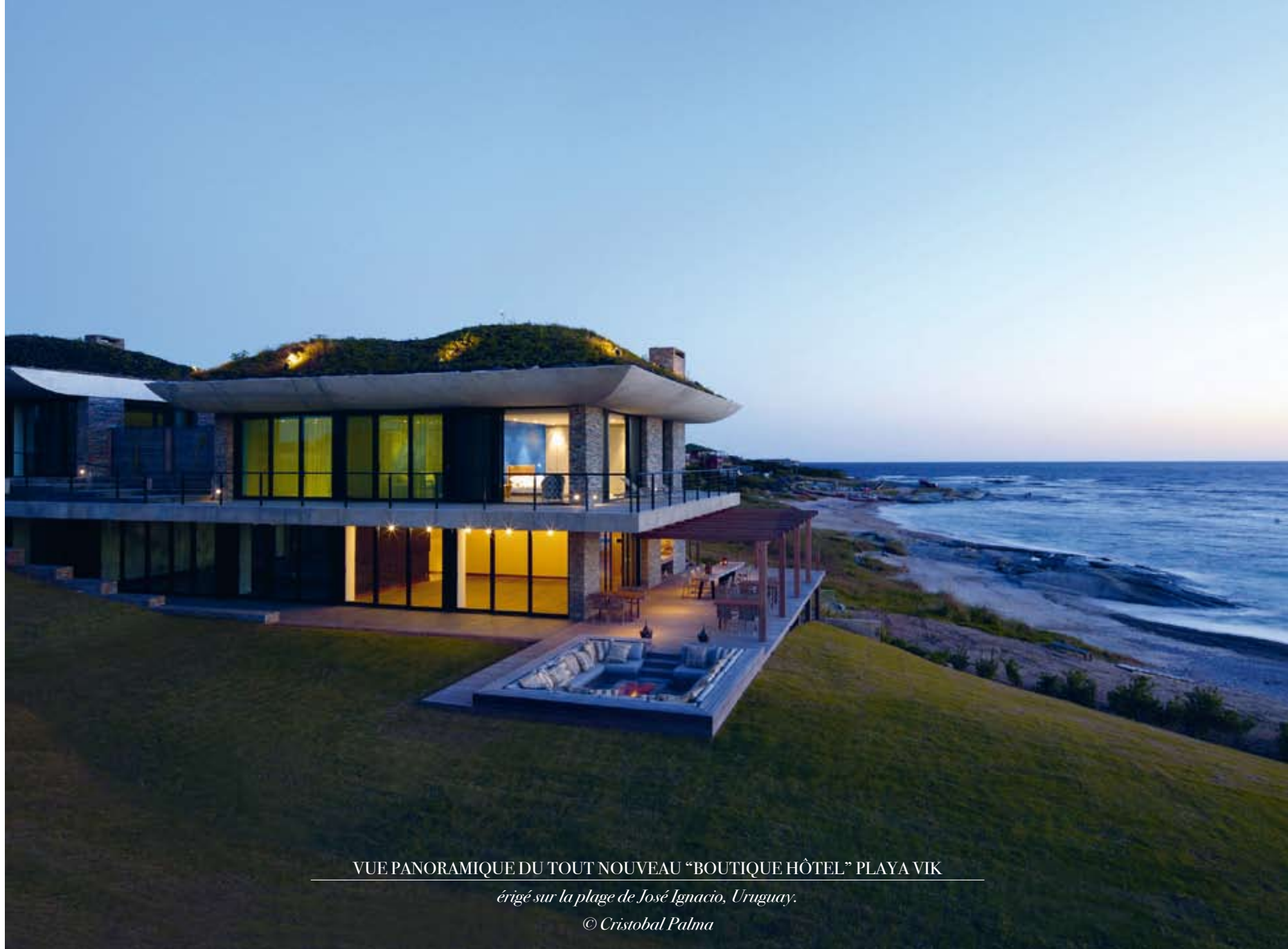
VUE PANORAMIQUE DU TOUT NOUVEAU “BOUTIQUE HÔTEL” PLAYA VIK