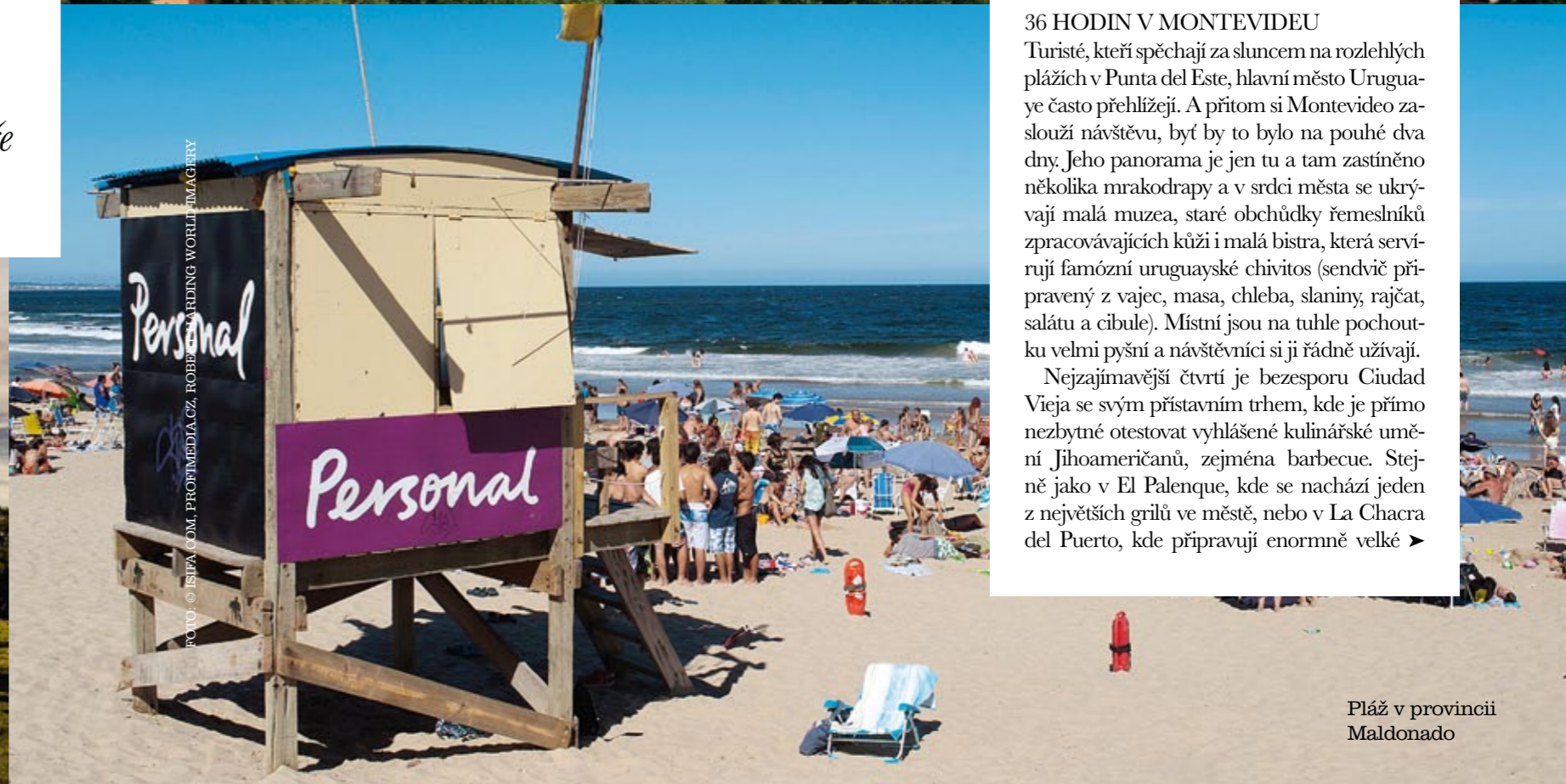
Pláž v provincii Maldonado

Nejzajímavější čtvrtí je bezesporu Ciudad Vieja se svým přístavním trhem, kde je přímo nezbytné otestovat vyhlášené kulinářské umění Jihoameričanů, zejména barbecue. Stejně jako v El Palenque, kde se nachází jeden z největších grilů ve městě, nebo v La Chacra del Puerto, kde připravují enormně velké ►