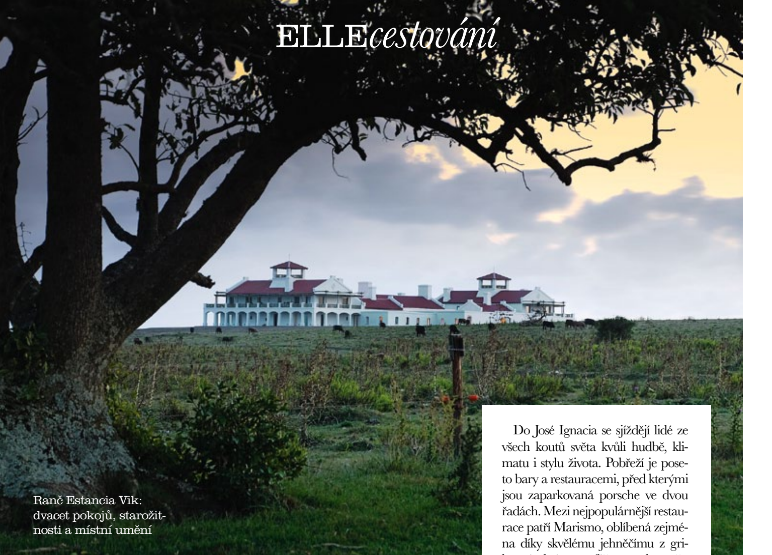
Ranč Estancia Vik: dvacet pokojů, starožit- nosti a místní umění

Do José Ignacia se sjíždějí lidé ze všech koutů světa kvůli hudbě, klimatu i stylu života. Pobřeží je poseto bary a restauracemi, před kterými jsou zaparkovaná porsche ve dvou řadách. Mezi nejpoblárnější restaurace patří Marismo, oblíbená zejména díky skvělému jehněčímu z grilu a útulné atmosféře se stoly osvětlenými jen svíčkami. Své kouzlo má také Parador La Huella, restaurant s panoramatickým výhledem přímo na pláži vyhlášený rybími pokrmy, kde se nikdy nezačíná obědovat před třetí hodinou odpoledne. Stejní majitelé otevřeli privé klub La Caracola, ke kterému se dá dostat pouze lodí. A jen pár minut od města byla postavena Laguna Escondida, obrovský resort s více než dvěma sty pokoji, s butiky a pohodlím, které uspokojí