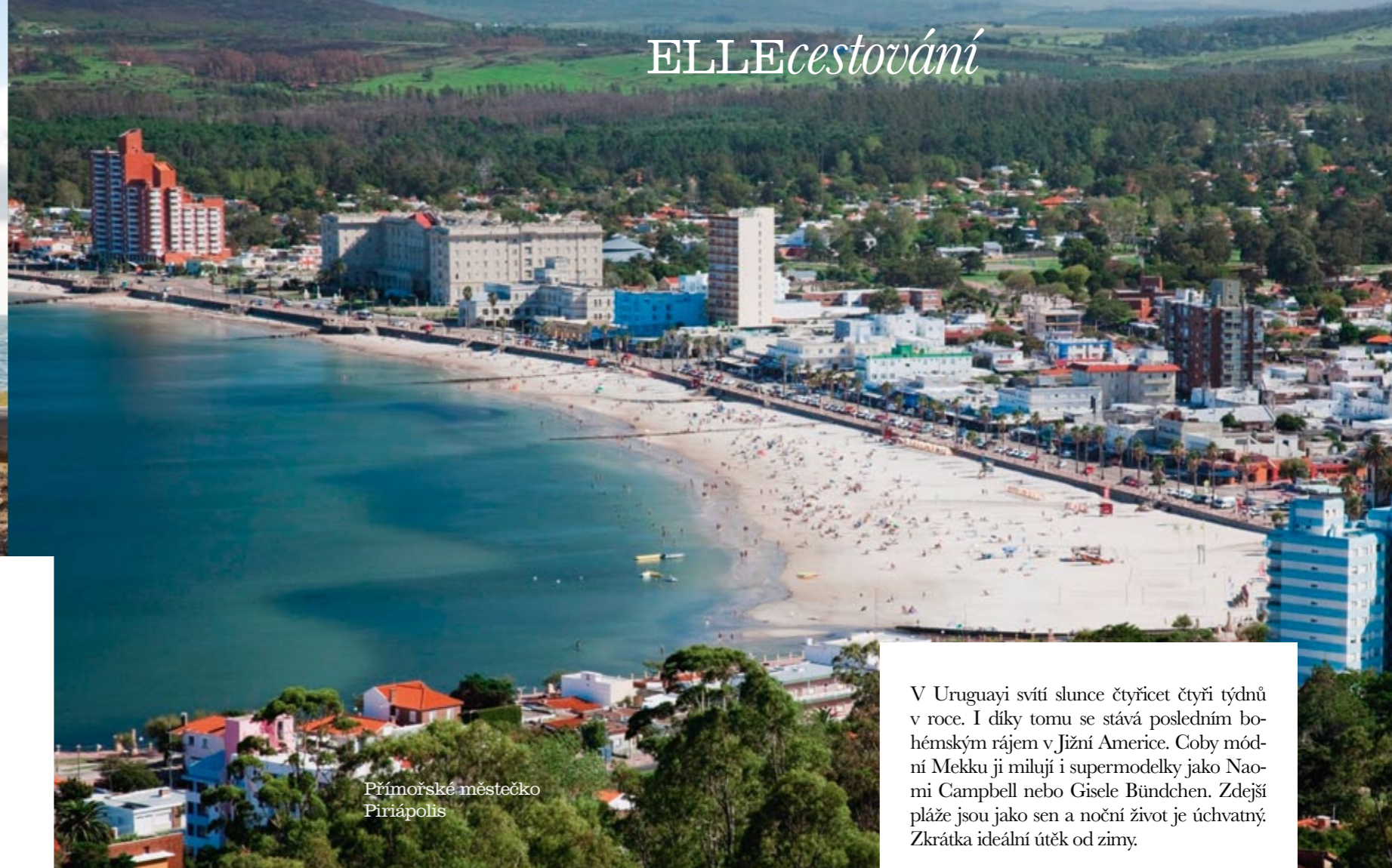
Přímořské městečko Piriápolis

V Uruguayi svítí slunce čtyřicet čtyři týdnů v roce. I díky tomu se stává posledním bohémským rájem v Jižní Americe. Coby módní Mekku ji milují i supermodelky jako Naomi Campbell nebo Gisele Bündchen. Zdejší pláže jsou jako sen a noční život je úchvatný. Zkrátka ideální útek od zimy.