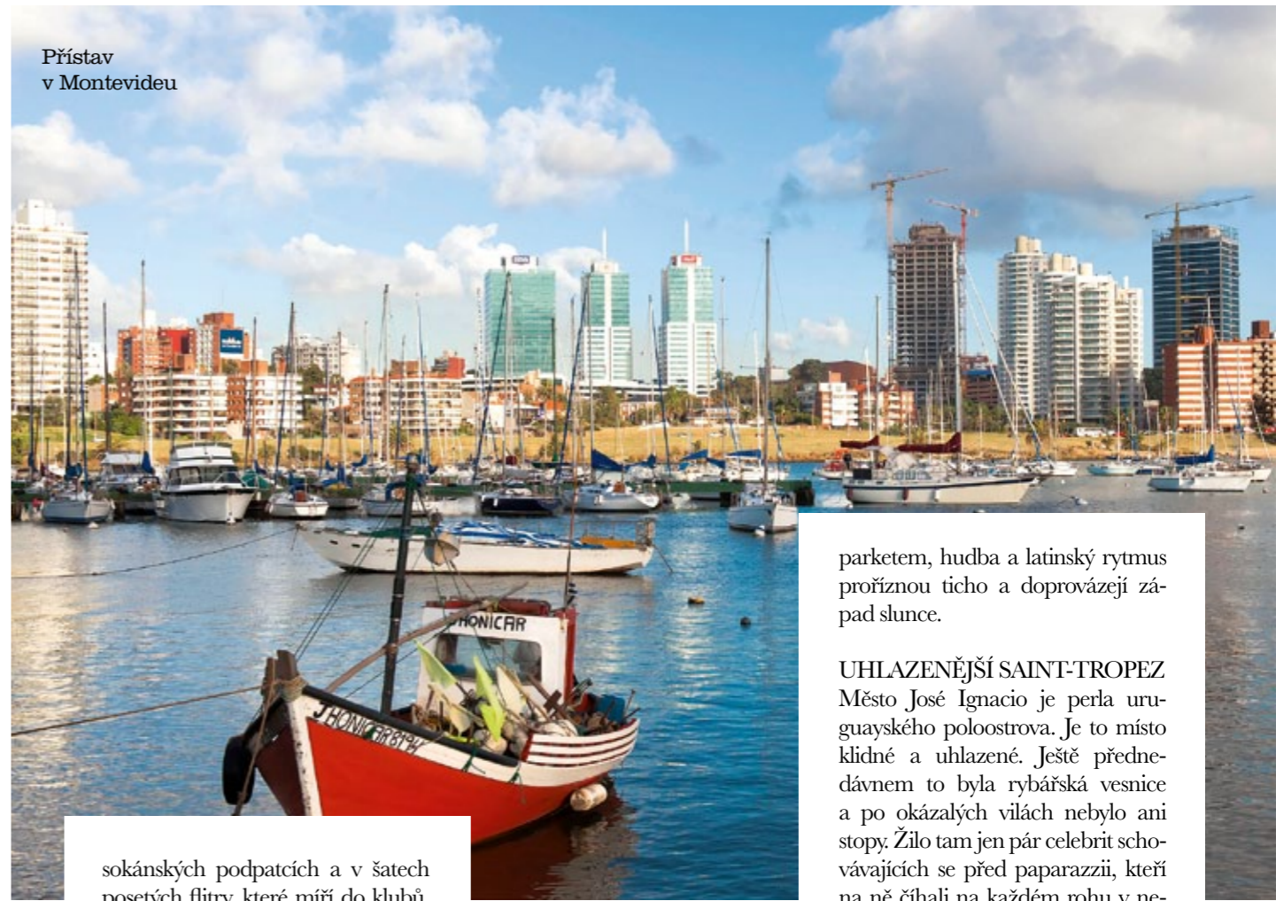
Přístav v Montevideu

sokánských podpatcích a v šatech posetých flitry, které míří do klubů. Astronomicky vysoké účty se přece platí až na konci dlouhého večera.