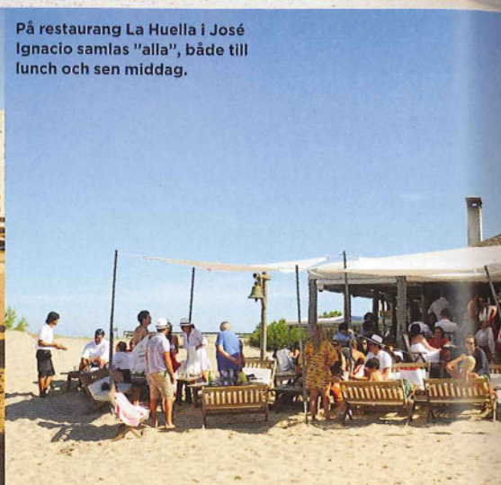
På restaurang La Huella i José Ignacio samlas "alla", både till lunch och sen middag.