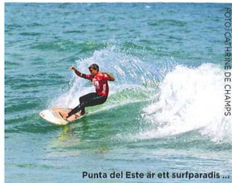
Punta del Este är ett surfparadis ...