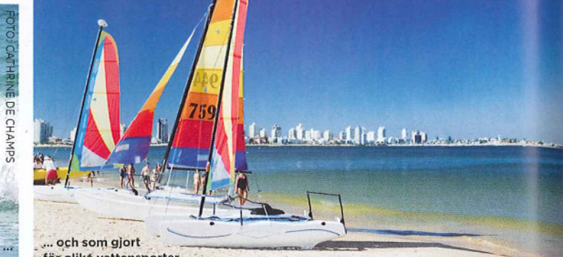
... och som gjort för olika vattensporter.