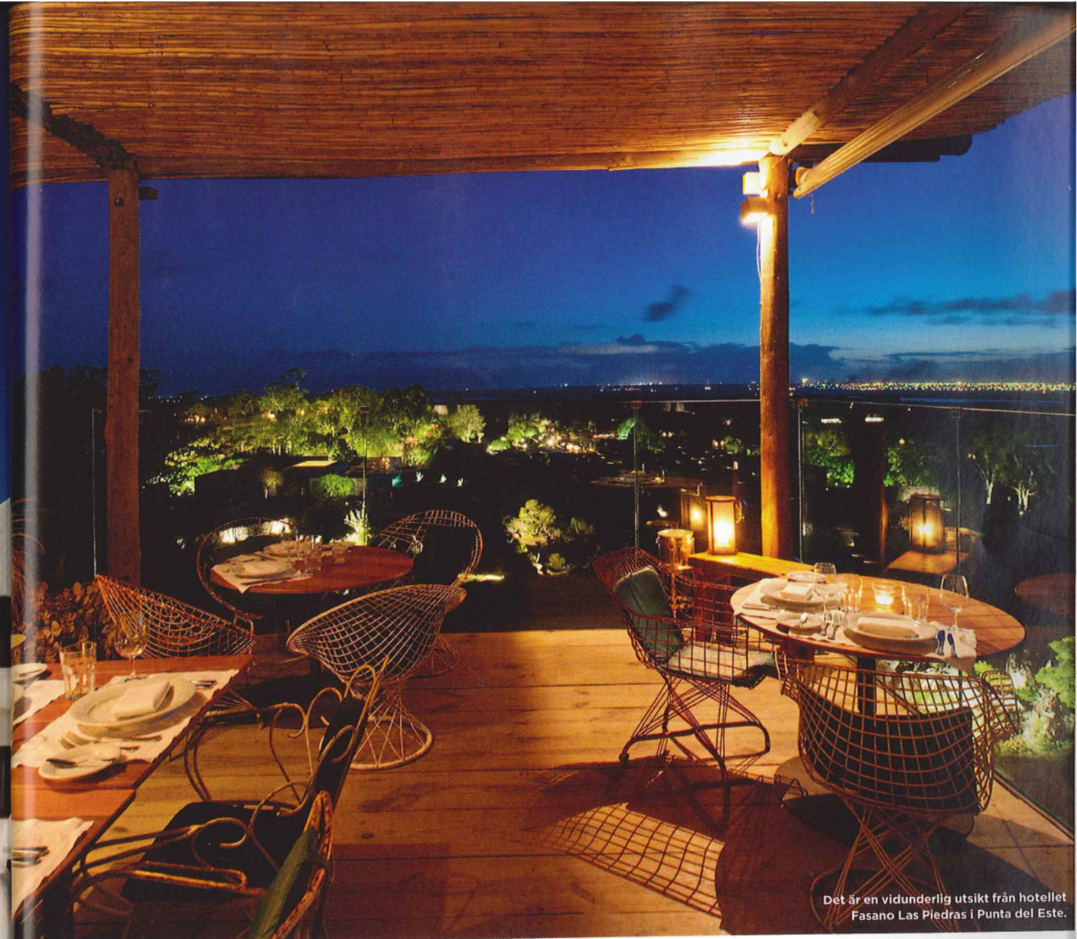
Det är en vidunderlig utsikt från hotellet Fasano Las Piedras i Punta del Este.

L atinamerikas Saint-Tropez brukar det kallas. Med sin långa kustremsa lockar uruguayanska Punta del Este främst välbärgade argentinare men också celebriteter från hela världen. Punta del Estes historia som glamourös och trendig jetsetfavorit går långt tillbaka i tiden.