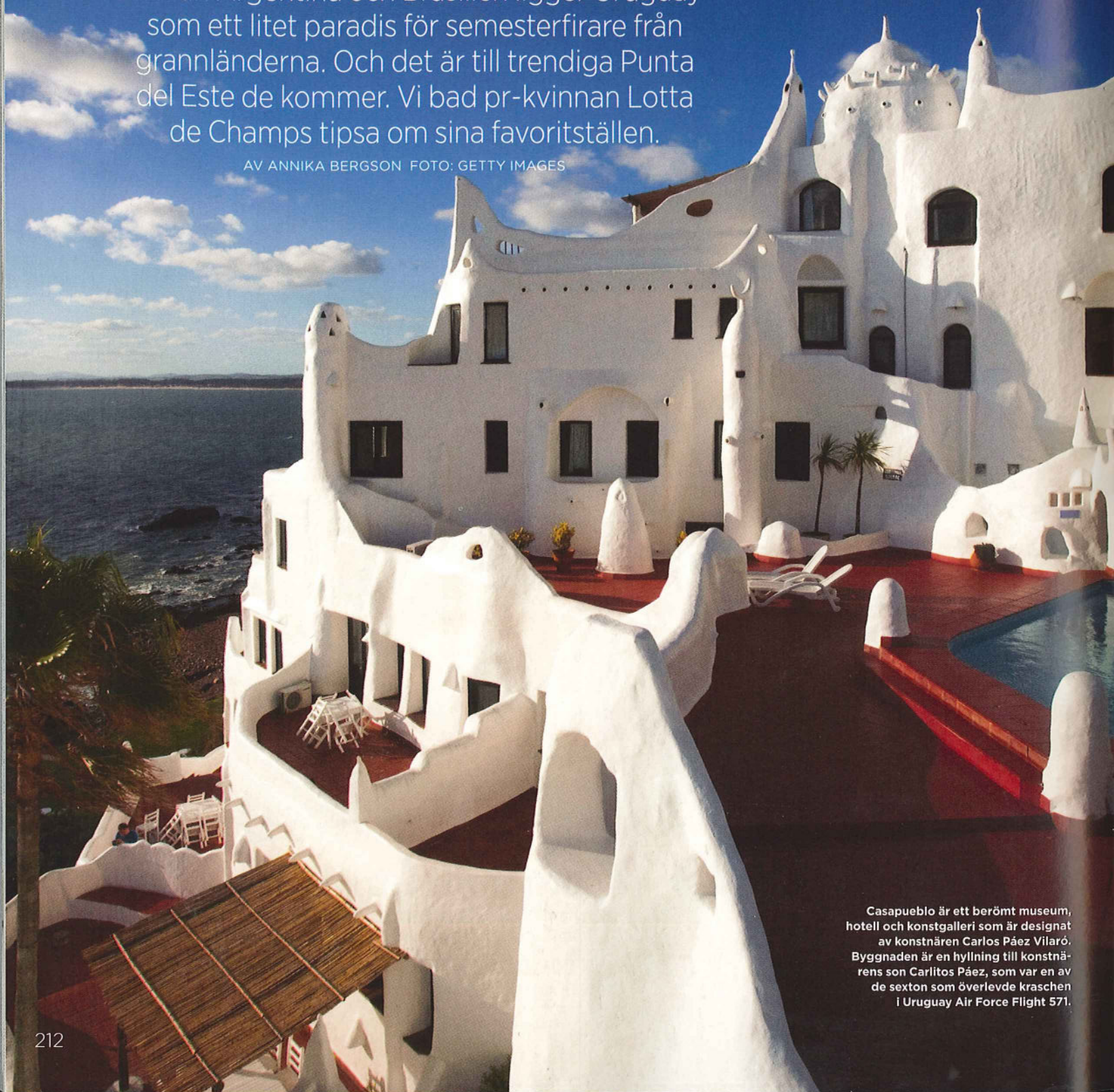
Casapueblo är ett berömt museum, hotell och konstgalleri som är designat av konstnären Carlos Páez Vilaró. Byggnaden är en hyllning till konstnärens son Carlitos Páez, som var en av de sexton som överlevde kraschen i Uruguay Air Force Flight 571.