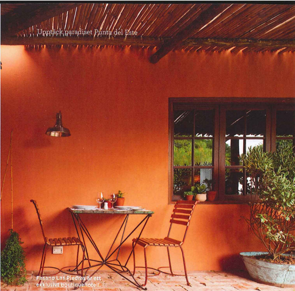
Fasano Las Piedras är ett exklusivt boutiquehotell.