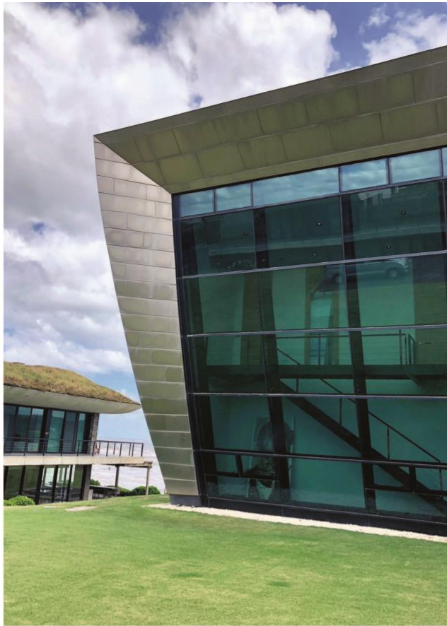
1. Playa Vik. 2. La salle à manger de l'Estancia Vik. 3. La piscine du Playa Vik. 4. Randonnée équestre à l'Estancia Vik. 5. Estancia Vik.