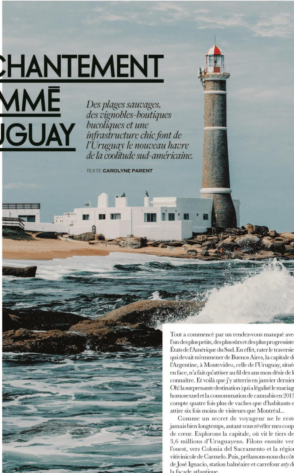
Le phare à José Ignacio.