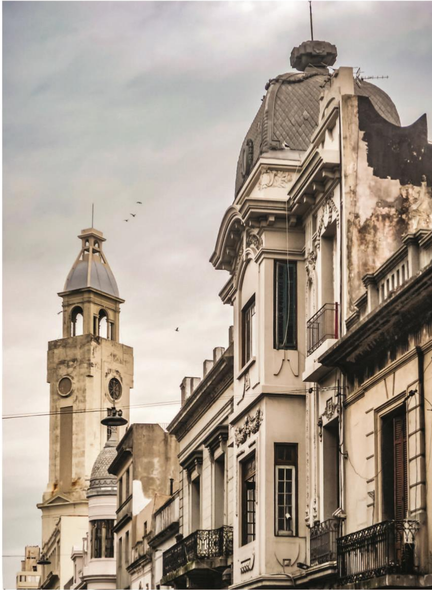
1. L'Architecture de Montevideo. 2. La Farmacia Cafe. 3. La Colonne de la Paix.