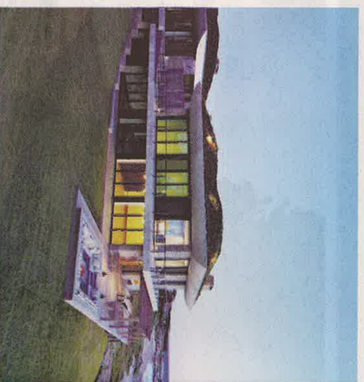
PLAYA VIK: Denne avanngårde-resorten åpner i sommer og består av ni luksussuiter i havgappet.