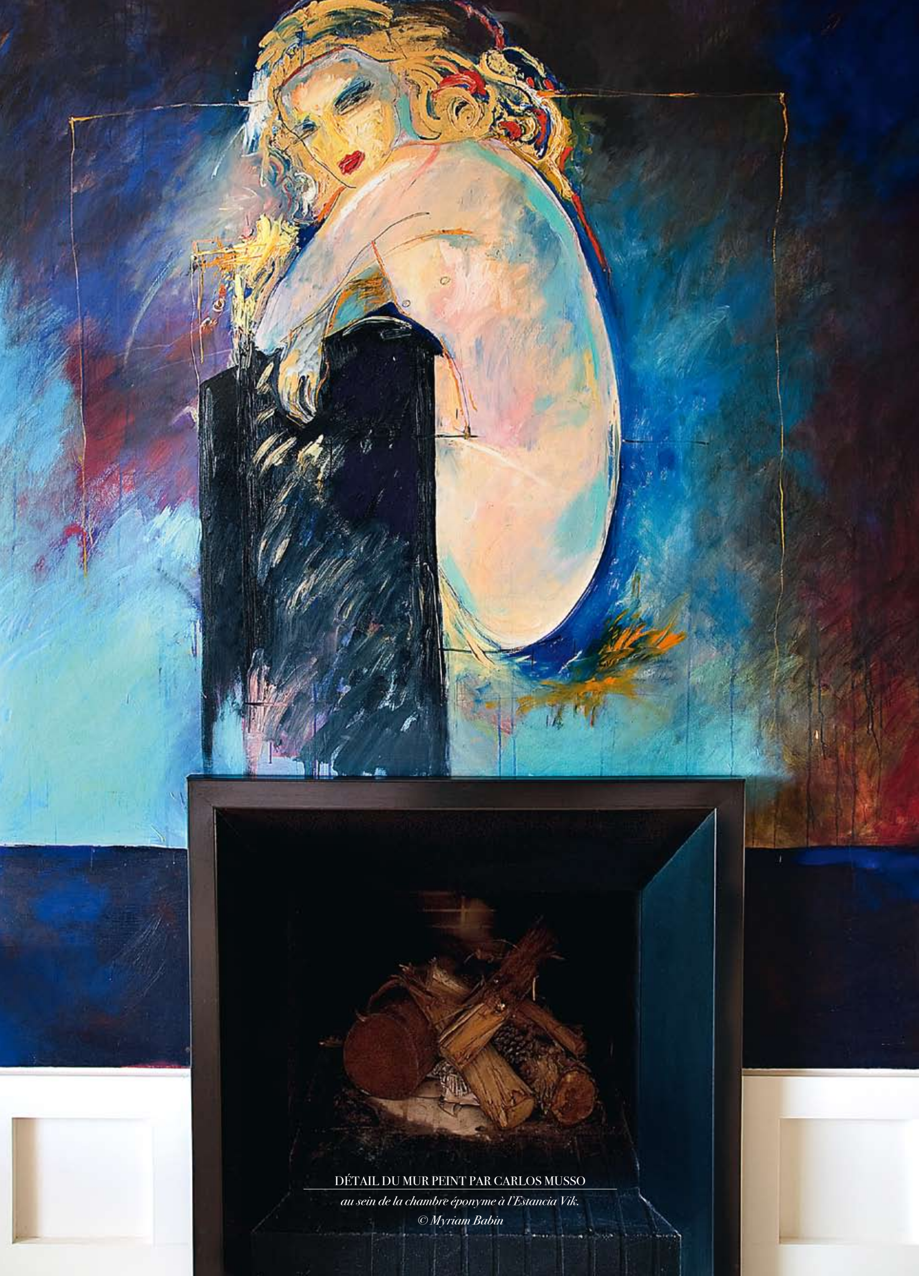
DÉTAIL DU MUR PEINT PAR CARLOS MUSSO au sein de la chambre éponyme à l'Estancia Vik.